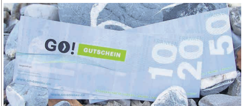
Praktisch und vielseitig: Die «Go!Gutscheine» sind bei allen Mitgliedern der Fachgeschäfte Gossau und Umgebung einlösbar und bieten damit vielfältige Geschenkmöglichkeiten. Erhältlich bei: acrevis bank, Braunwalder Haushalt Gossau, Metzgerei Grübler Gossau, Andwiler Dorfläden.