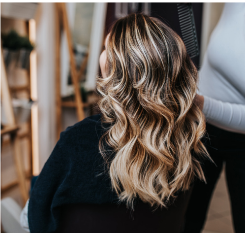
Locken und Balayages setzen frisurentechnisch den Trend dieses Frühjahrs.