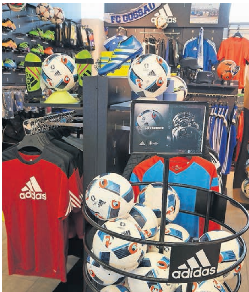
Ball, Schuhe und Schienbeinschoner sind auf die EM ausgerichtet.

Fussball-EM und Olympische Spiele strahlen nur bedingt auf Gossau aus