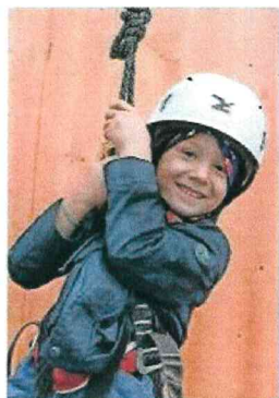
Die Kids können sich im Abenteuerpark der Pfadi vergnügen.

Stadtzentrum Biermuda, Mediterraneo und vino e arte – das Gossauer Strassenfest wird in diesem Jahr mit Sicherheit eines: abwechslungsreich. Über 20 verschiedene Biere an drei Bierständen werden