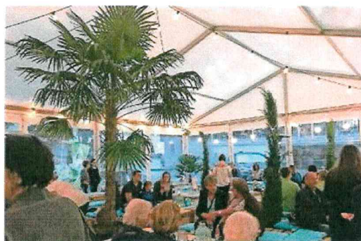
Das Zelt «Mediterraneo» verspricht mit Wein und Antipasti einen Hauch Italien.