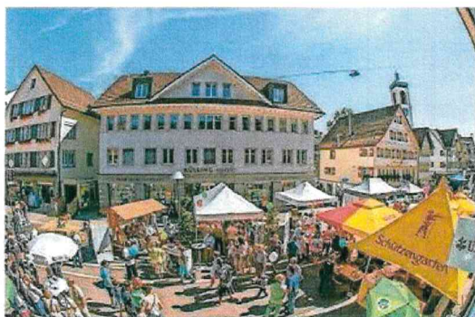
Am Samstag, 31. August, findet die 7. Austragung des Gossauer Strassenfestes statt.

den Besuchern angeboten. Das Zelt «Mediterraneo» auf dem Toggiplatz verspricht mit Wein und Antipasti einen Hauch Italien. Ergänzt wird das Ganze durch ein Beachfeld gleich nebenan. Anschliessend sorgt die Band «Rost:frei» für Unterhaltung. Am ehemaligen Standort des Braunwalders feiert die «vino e arte» ihre Neueröffnung.