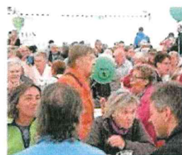
Im sogenannten Biermuda-Dreieck sind alle drei Gossauer Brauereien präsent. pd

In diesem Jahr warten wiederum viele akustische Highlights auf die Besucher. Nebst den Tambouren und Stadtmusik haben auch das Saxofon-Quartett, das Akkordeonorchester und Tanzgruppen einen Auftritt. Abwechslung wird auch für die Kleinen angestrebt. Für die Kinder stehen verschiedene Hüpfburgen, eine Ballonkünstlerin, ein Streichelzoo sowie ein Abenteuerpark der Pfadi bereit. Erwartet werden mehrere Tausend Besucher am Strassenfest.