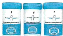
Mineralstoffe nach Dr. Schüssler sorgen für ein Inneres Gleichgewicht.

Steigende Anforderungen, wachsende Belastungen und sich verändernde Umwelt- und Ernährungsbedingungen können unseren Organismus aus dem Gleichgewicht bringen. Erste Anzeichen sind häufig gestörte Zellfunktionen, die sich in einem veränderten Stoffwechsel zeigen. Die Anzeichen können sehr un-