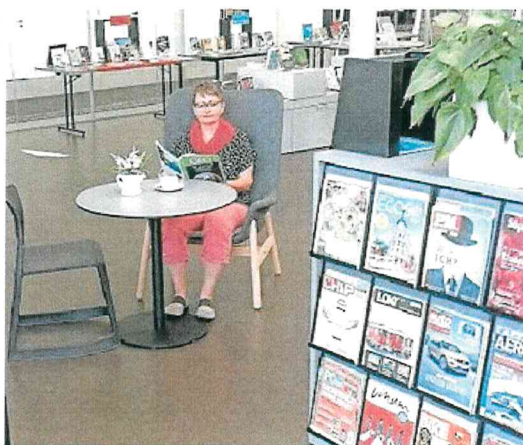
In der Stadtbibliothek Gossau ist jedermann herzlich eingeladen, sich gemütlich hinzusetzen, einen Kaffee zu trinken und zu lesen.

Kontakt: Arbeitsgruppe Littering der Stadt Gossau Infos: aufraeuen@gossau.net 071 222 02 20