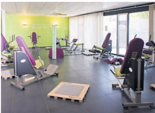
AMIGA Fitness Dianastrasse 3 | Gossau | Tel. 071 383 93 93 oder E-Mail info@amiga-fitness.ch | www.amiga-fitness.ch