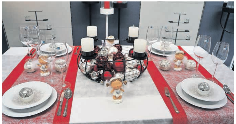
Ein festlich geschmückter Tisch gehört an Weihnachten dazu.

Beim Blick ins Ausland wird die Vielfalt und Unterschiedlichkeit des Weihnachtsfestes deutlich. Bei den Nachbarn in Österreich bringt ebenfalls das Christkind die Geschenke. Das gilt ebenso für Deutschland, wo der Weihnachtsmann und der St. Nikolaus ein und dieselbe Person sind. In Dänemark beginnen die Feierlichkeiten bereits am 23. Dezember. Dieser Tag heisst bei den Dänen «Lillejuleaften», kleiner Heiligabend. Am Nachmittag wird überall im Land gemeinsam Apfelkuchen und Tee genossen. Genau wie in Schweden