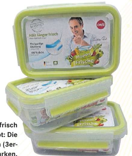
› Damit alles frisch und knackig bleibt: Die Frischhaltedosen (3er-Set) für 60 Marken.