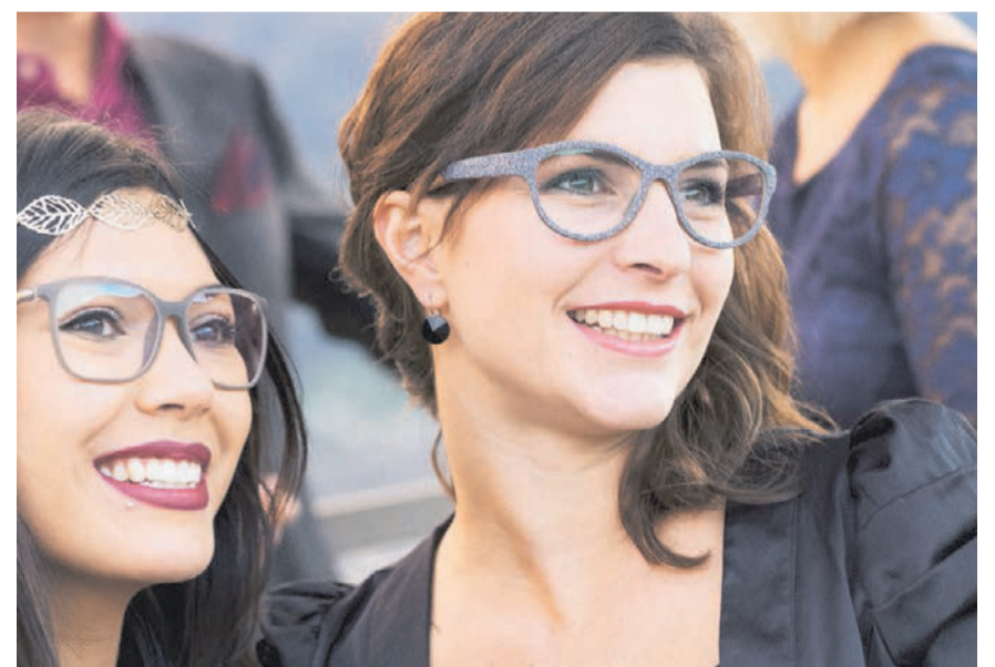
Individueller geht nicht: Brillen aus Naturmaterialien.

Besonders begehrte Produkte wie die neuen, handgefertigten Schönheiten