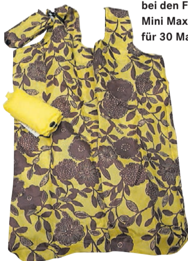
› Praktisch und für den Einkauf bei den Fachgeschäften. Einen Mini Maxi Shopper erhalten Sie für 30 Marken.