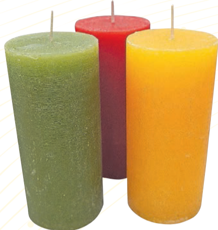
› Für gemütliche Stunden zu Hause: Kerzen in diversen Farben für 45 Marken.

★ Jede eingelöste Sammelkarte nimmt zusätzlich an der grossen Verlosung teil. Zu gewinnen gibt es 5 Fachgeschäfte-Gutscheine à jeweils 300 Franken und 15 Fachgeschäft-Gutscheine à jeweils 100 Franken. Diese können Sie bei allen Mitgliedern der Vereinigung Fachgeschäfte Gossau und Umgebung einlösen. Gerne bedienen die Fachgeschäfte ihre Kundschaft auch in Zukunft fachkundig und kompetent und heissen sie herzlich willkommen in ihren Geschäften.