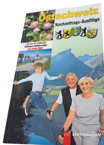
› Perfekt organisiert zum Ausflug: Für 120 Marken erhalten Sie das Taschenbuch «Nachmittags-Ausflüge».