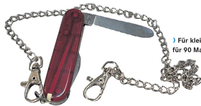
› Für kleine Hände: Kindersackmesser für 90 Marken.