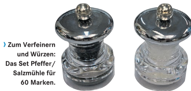
› Zum Verfeinern und Würzen: Das Set Pfeffer/Salzmühle für 60 Marken.