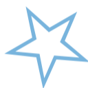
› Für Musik und Unterhaltung können Sie die Mundharmonika für 60 Marken bekommen.