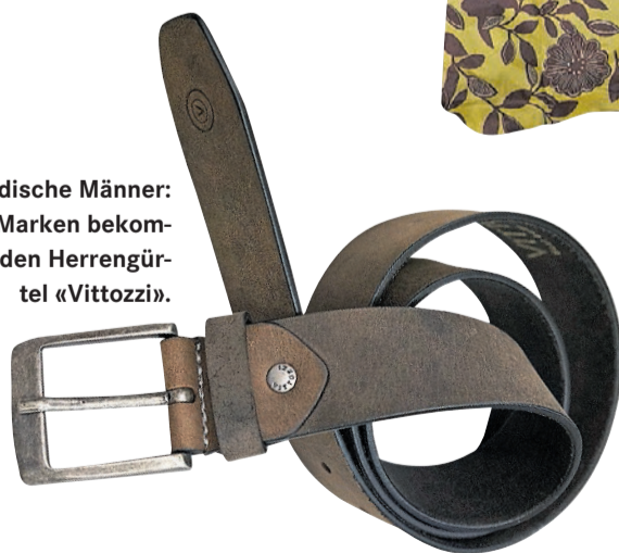
› Für modische Männer: Für 120 Marken bekommen Sie den Herrengürtel «Vittozzi».