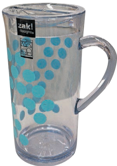
› Für Tee oder Wasser eignet sich der ZAK Krug mit Tupfen 1,7 Liter für 90 Marken als Eintauschmöglichkeit.