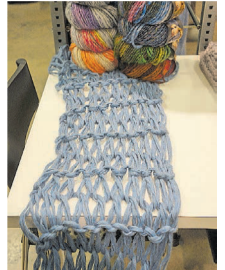
Auch handgestrickt wärmt ein Schal.