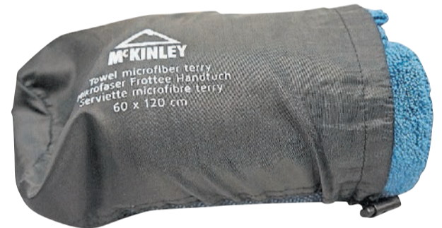
› Beim Wandern oder beim Sport, ein Microfasertuch darf auf keinen Fall fehlen: Für 60 Marken erhalten Sie diesen Artikel.