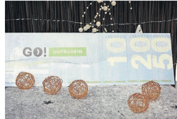
› Immer beliebt: Den Warengutschein im Wert von 5 Franken können Sie für 30 Marken in allen Fachgeschäften einlösen.