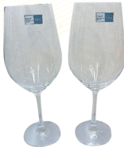
› Das Gläser-Set (2 Stück) erhalten Sie für 60 Marken.