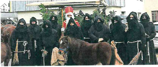
Der Besuch des Chlause mit seinen Gehilfen bringt Kinderaugen zum Leuchten.

«Gschenklisunntig» Verschiedene Aktivitäten machen das Einkaufen zu einem Highlight für Jung und Alt. Insbesondere der Besuch des Chlause bringt Kinderaugen zum Leuchten. Um etwa 14 Uhr ist der Chlaus auf dem Toggenburger Platz anzutreffen, um etwa 15 Uhr beim Polizeiposten und um 16 Uhr auf dem Platz vor der Andreaskirche. Zudem gibt es für die Kinder ein Karussell, der Esel kann gestreichelt und ein gratis Chlaussäckli in Empfang genommen werden. Die Eltern