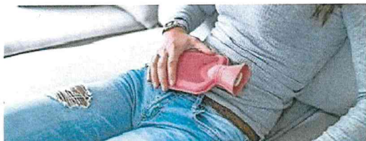
Auch die Wärme einer Bettflasche kann bei Krämpfen im Unterbauch helfen. Abgabe: Stock