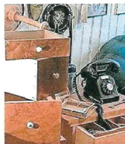
Im Brocki-Treff finden sich allerlei Sammlerstücke. 7 x 7

Mehrmals wöchentlich geht sie auf Jagd nach neuen Juwelen, welche anschliessend im Brocki auf neue Liebhaber warten. Vielfach hat sie auch die Möglichkeit, bei Privaten einzukaufen. Neben ihrer Sammler-